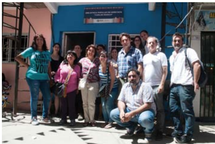
Visita a la Biblioteca Popular "Delta del Paraná"