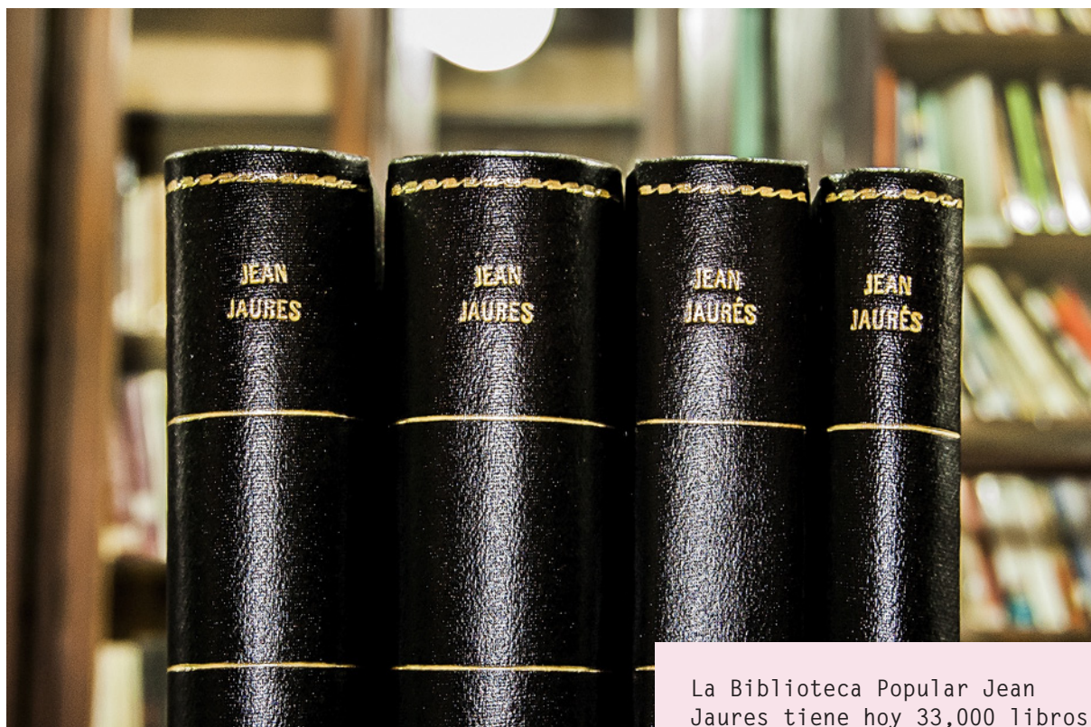
La Biblioteca Popular Jean Jaures tiene hoy 33,000 libros.

cuales se asociaron a la biblioteca y algunos prestaron importantes servicios como integrantes de su Comisión Directiva.