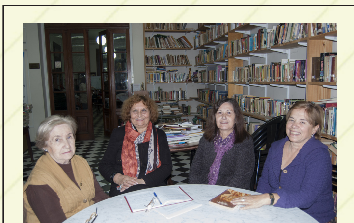
Parte de la Comisión Directiva en la sala de lectura.

Las actividades con la escuela de arte son importantes para el recambio generacional: realizan peñas y otras actividades que traen muchos jóvenes a la biblioteca. "Buscábamos el recambio generacional y lo logramos a través del grupo de la Escuela de Arte que nos ha ayudado muchas veces, porque son músicos, artistas y porque tienen ese tipo de inquietudes que movilizan a las nuevas generaciones" , revelan desde la Comisión Directiva y agregan: "estamos bastante abiertos a la comunidad, también con los educadores y con los jubilados tenemos mucho contacto que cada 15 días nos piden un lugarcito para reunirse y vienen a la biblioteca" .